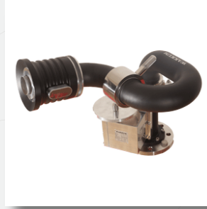
Su ve Köpük Monitörü